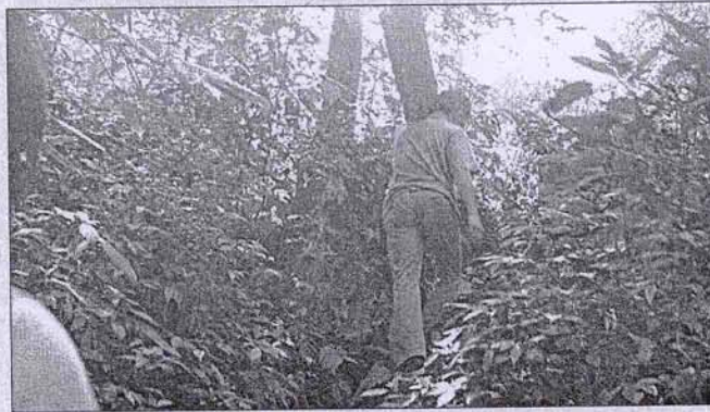
● Sau đợt truy quét gỗ lậu, rừng Thần Sa lại nhộn nhịp lâm tặc.

người vào - kẻ ra, cười nói rộn ràng, hỏi nhau những câu quen thuộc "Mày chuyển rồi?". Người ra thì vác mỗi người một thanh vai gỗ nghiêng nặng khoảng 50kg, dài 2m, dày 8cm, rộng 20cm. Những người đi vào, có người thì đi tay không, có người cầm theo can xăng và một ít thức ăn. Theo lời Ty, người đi tay không là dân vác gỗ, người cầm xăng và thức ăn là dân xẻ gỗ. (Còn tiếp)