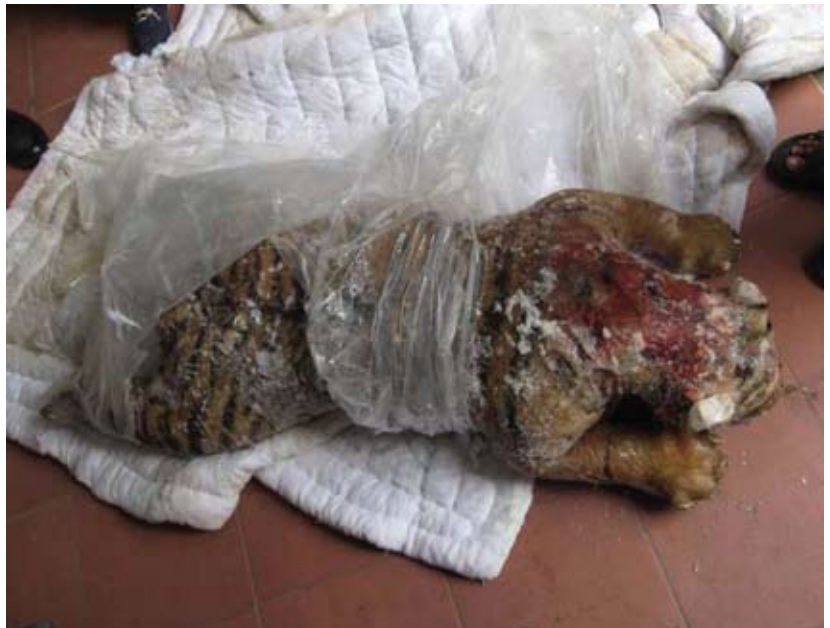
Hình thức trại nuôi hổ và vườn thú tư nhân là vỏ bọc lý tưởng cho hoạt động kinh doanh phạm pháp. Động vật mới sinh và đã chết trong tình trạng nuôi nhốt có thể bị buôn bán bất hợp pháp.

Trên thực tế, nếu các cơ quan chức năng thực sự quan tâm đến việc duy trì một số lượng hổ để chuẩn bị cho ngày mà loài hổ không còn hiện diện trong tự nhiên nữa, thì sáng kiến nuôi hổ để bảo tồn phải được thực hiện dưới sự giám sát trực tiếp của một cơ quan trực thuộc Chính phủ. Việc làm này để đảm bảo rằng gây nuôi hổ cần làm thực sự phục vụ mục đích bảo tồn, hổ con phải được kiểm kê và hổ chết phải được thông báo và xử lý hợp lý.