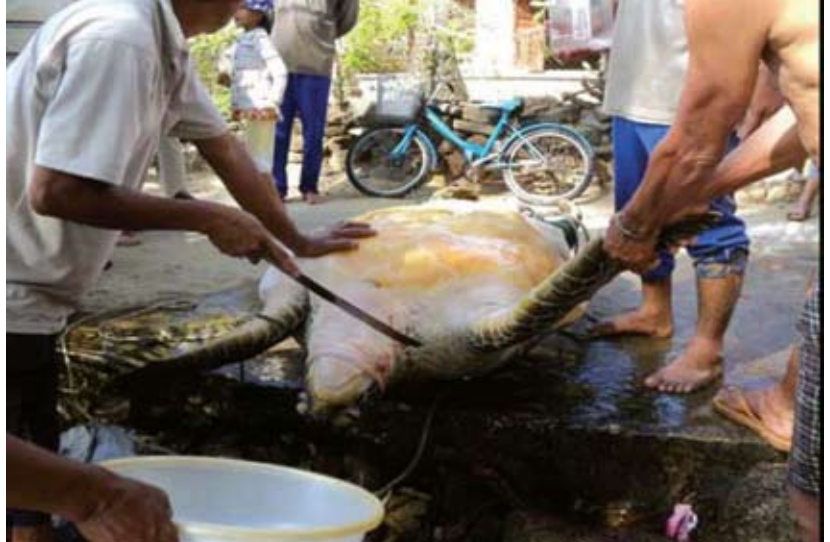
Cách đây không lâu, một cá thể rùa biển đã bị những người dân ở huyện Núi Thanh tỉnh Quang Nam giết và chặt đầu.

Ngày 10/01, cơ quan chức năng tỉnh Thanh Hóa đã bắt giữ một đối tượng buôn bán trái phép một lô