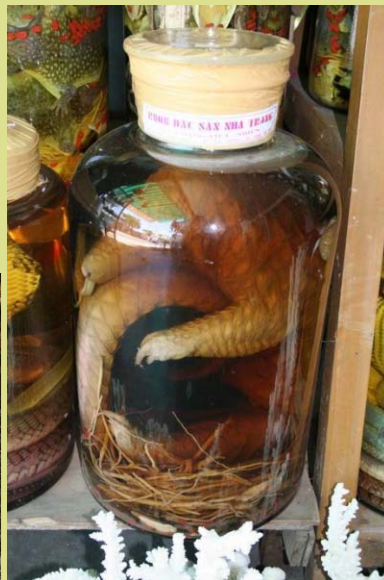
Một bình rượu tê tê tại một nhà hàng ở Nha Trang. Hầu hết tê tê sẽ bị xuất sang Trung Quốc trong khi số khác sẽ kết thúc số phận trong những bình rượu ngâm hoặc trở thành các món ăn trong các nhà hàng đặc sản ở Việt Nam. Cả hai loài tê tê đều thuộc nhóm IIB và được pháp luật bảo vệ trong Nghị định 32.