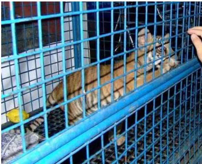
Một cá thể hổ con tại một vườn thú giải trí tư nhân ở tỉnh Bình Dương. Khách tham quan có thể xem động vật, mua mật gấu hoặc gọi các món ăn từ động vật hoang dã ở nhà hàng của vườn thú.

Chúng ta nên bắt đầu bằng việc tự cam kết sẽ làm tốt vai trò của mình với tư cách là cán bộ kiểm lâm, những người thực thi pháp luật, những cán bộ của các cơ quan liên quan, và những người đưa ra quyết định. Nếu không có sự quan tâm và lòng yêu nghề thực sự, thì pháp luật và cơ