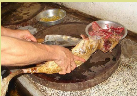
Một cá thể nhím đang bị làm thịt trong một nhà hàng đặc sản thịt thú rừng ở Hà Tây.

Cơ quan quản lý CITES Việt Nam: (04) 7335676