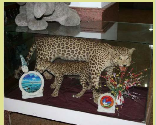
Hai con báo nhồi bông này được trưng bày ở hành lang của một khách sạn tại Quy Nhơn. Tàng trữ các loài động vật đã được bảo vệ, thậm chí là mẫu vật như những con báo này, đều là phạm pháp.