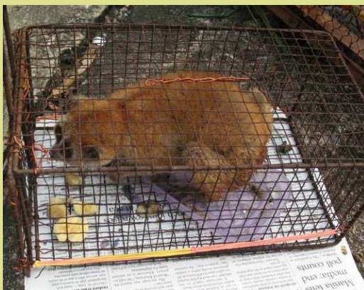
Cá thể culi này được Kiểm lâm huyện Cát Hải (thành phố Hải Phòng) tịch thu sau khi một khách du lịch thông báo đến đường dây nóng bảo vệ ĐVHD của ENV. Cá thể culi này sau đó đã được chuyển giao về Trung tâm Cứu hộ Linh trưởng Ngụy cấp ở VQG Cúc Phương.