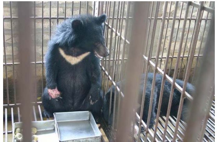
Một cá thể gấu với bàn tay bị thương tại một trại nuôi gấu ở ngoại thành Hà Nội. Khách hàng tìm đến đây vào các ngày chủ nhật để mua mật gấu và chứng kiến quá trình trích hút mật. Bán mật gấu là phạm pháp, ngay cả khi gấu đã được đăng ký với chính quyền địa phương.

Trong những năm gần đây, khi nền kinh tế ngày một tăng trưởng, nhu cầu tiêu thụ ĐVHD cũng tăng lên đáng kể. Sự xuất hiện ngày càng nhiều của những nhà hàng, cửa hàng, cơ sở kinh doanh, quảng cáo ĐVHD khiến cho công việc của thực thi pháp luật của cơ quan chức năng càng khó khăn hơn.