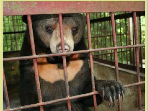
Cá thể gấu chó này bị buôn bán trái phép và đã được chính quyền Nghệ An tịch thu tại Vườn quốc gia Pù Mát.