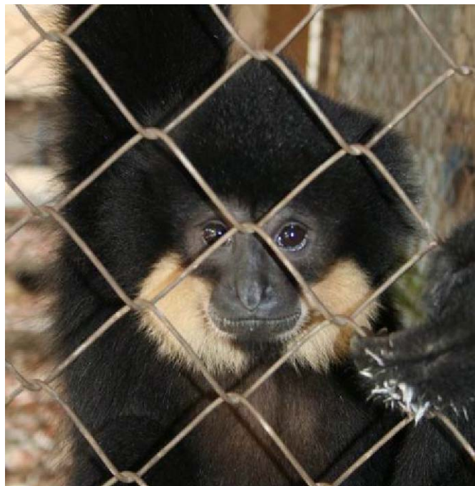
Một trong số ba cá thể vượn đen má hung tại một nhà hàng ở Đồng Nai. Chi cục kiểm lâm đang có kế hoạch sớm chuyển giao những cá thể vượn này cho trung tâm cứu hộ.

Bình Thuận: Một cán bộ kiểm lâm đã tự nguyện chuyển giao ba cá thể vượn cho Trung tâm cứu hộ Củ Chi tại Thành phố Hồ Chí Minh sau khi nuôi nhốt các động vật này trong 6 năm. ( Thông tin được lưu trong hồ sơ số 656 ).