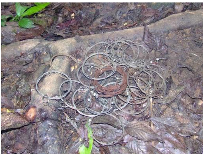
Hàng chục bẫy thú rừng thu được tại một khu bảo tồn thiên nhiên ở miền Trung Việt Nam. Rừng cần được bảo vệ. Nếu chúng ta không thể bảo vệ động vật hoang dã trong tự nhiên, rừng sẽ cạn kiệt.

Lượng xuất khẩu ĐVHD từ Việt Nam, những loài được săn bắt từ chính những khu rừng của chúng ta, có thể giảm do săn bắt quá mức từ giữa những năm 90. Tuy nhiên, đồng thời việc buôn lậu ĐVHD vào Việt Nam và qua Việt Nam vẫn không hề suy giảm. Khi những kẻ buôn bán ĐVHD bị phát hiện, chúng chỉ bị "vỗ" bằng những khoản tiền phạt nhẹ. Rất ít phải vào tù.